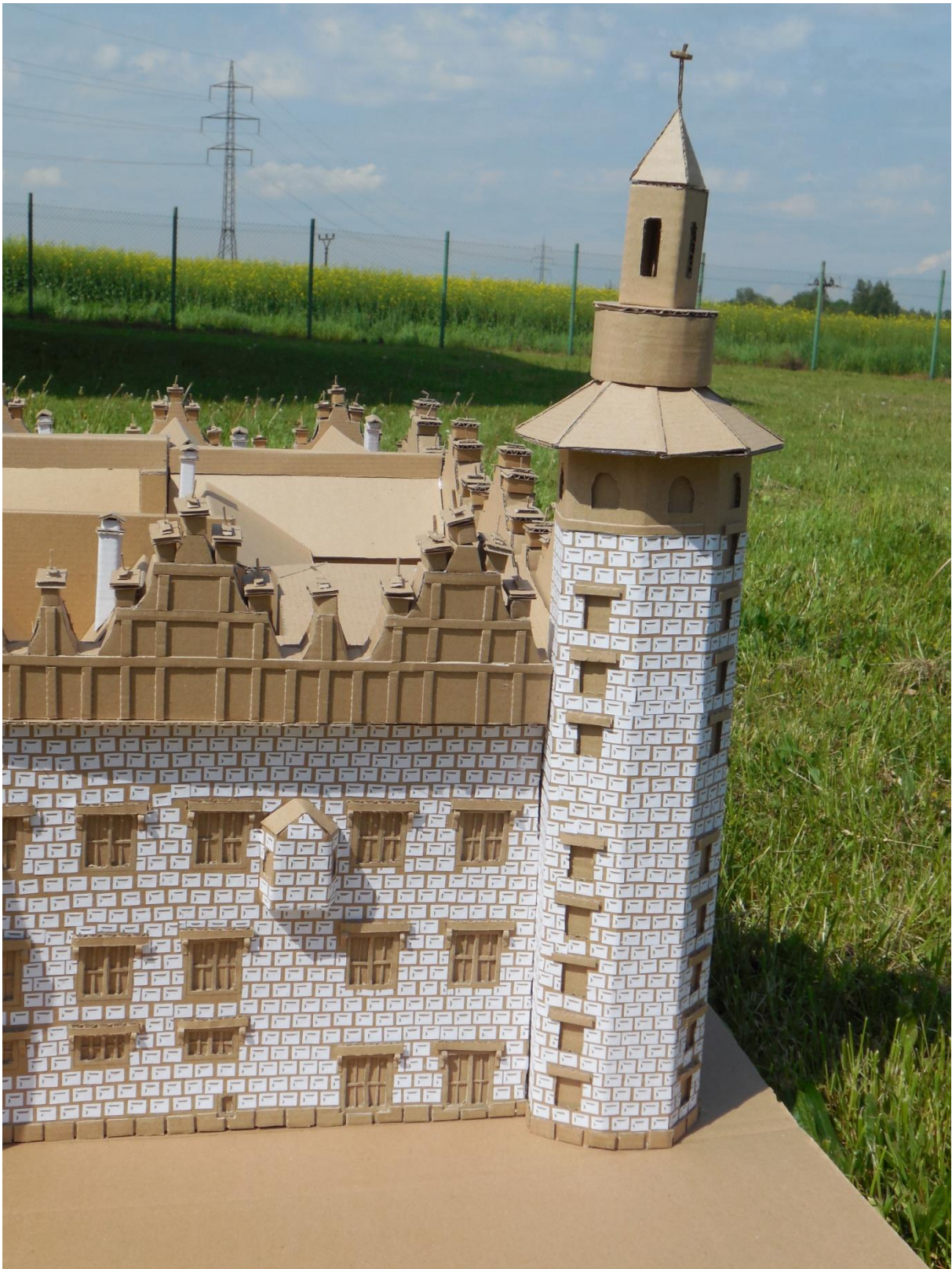
Obr. 2: Věž zámku zblízka