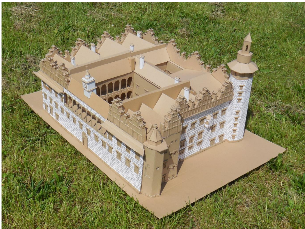
Obr. 1: Zámek z boku vsazen do krajiny

Používaly jsme vlnitou lepenku v několika tloušťkách hnědé a bílé barvy, bílý papír na výrobu sgrafit a lepicí materiál. Práce to byla velmi titěrná, ale opravdu nás bavila a snažily jsme se zámek vystihnout co nejvíce do detailů. S naší stavbou z vlnité lepenky jsme nadměru spokojené a trůfáme si říct, že jsme se od minulého roku zlepšily.