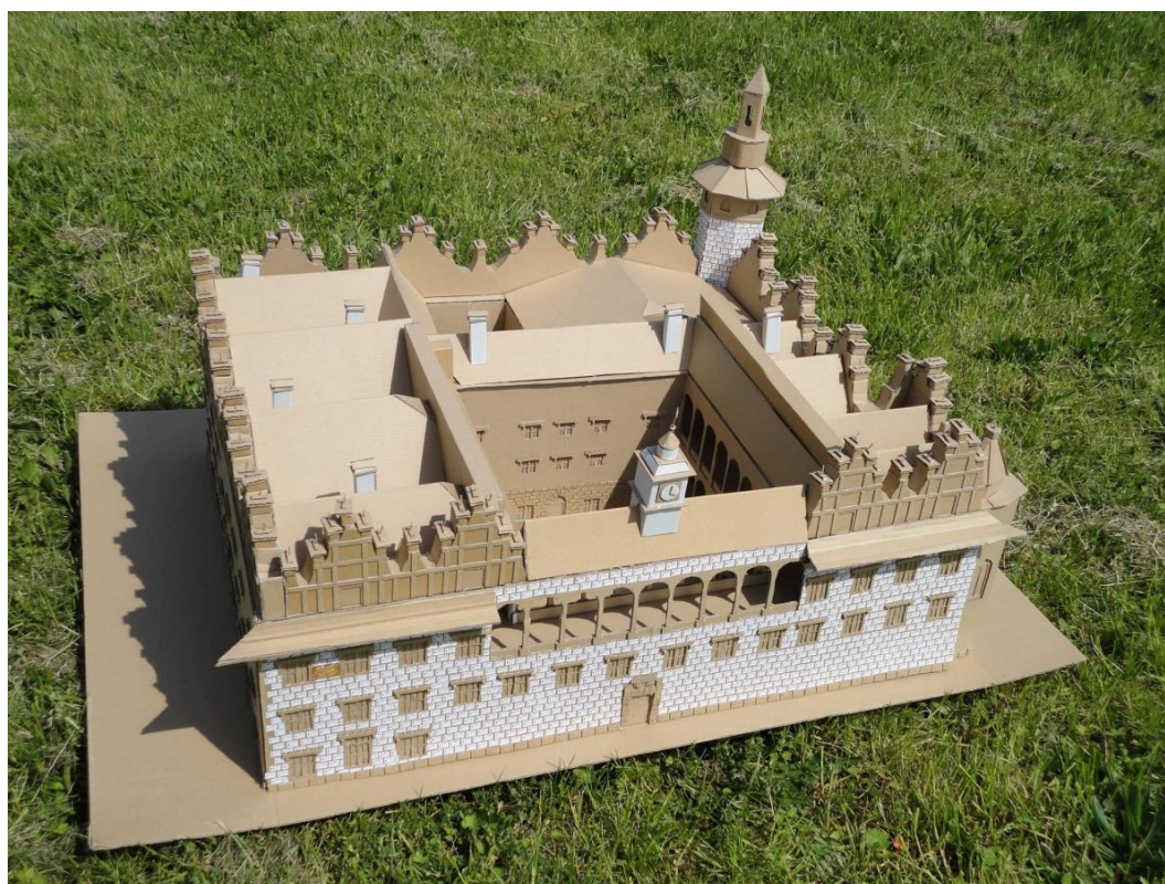
Obr. 10: Zámek Litomyšl z průčelí