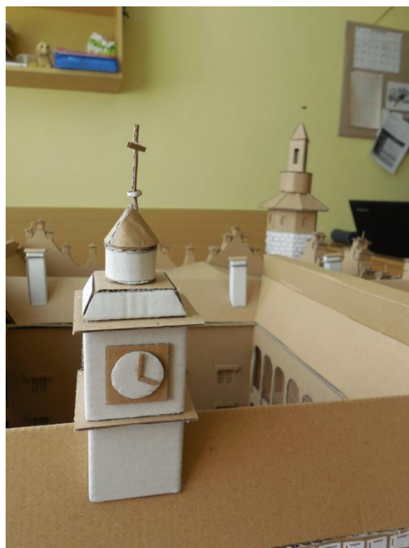
Obr. 6: Detail hodin