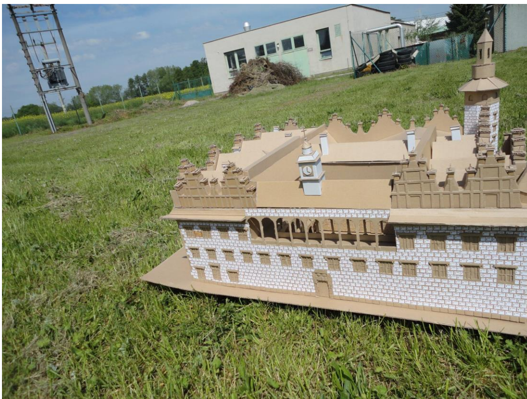
Obr. 9: Zámek Litomyšl s okolím