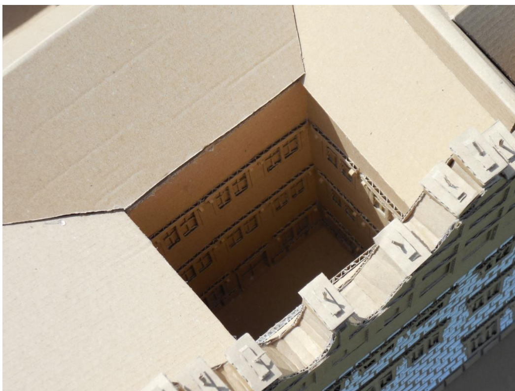
Obr. 4: Menší nádvoří shora