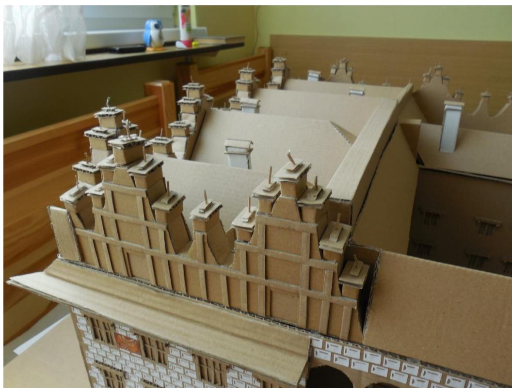
Obr. 7: Detail atiky a římsy