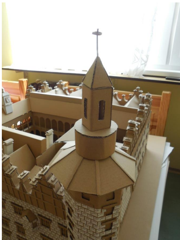
Obr. 5: Detail věžičky