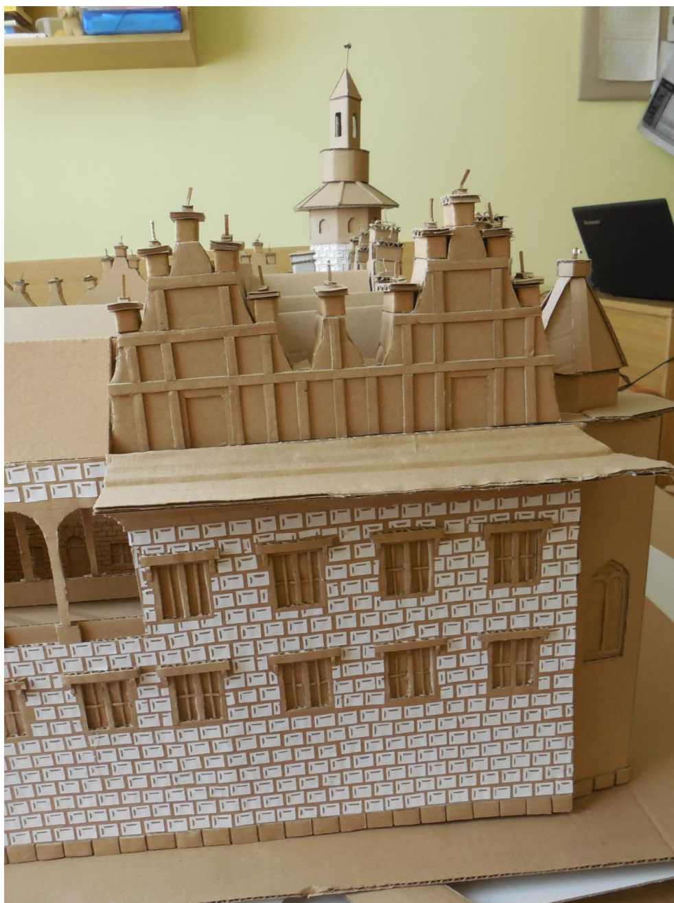
Obr. 8: Detail atiky a sgrafit